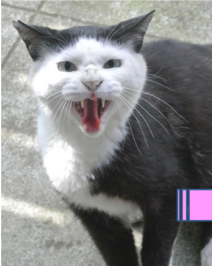
凶暴なのらねこも・・・