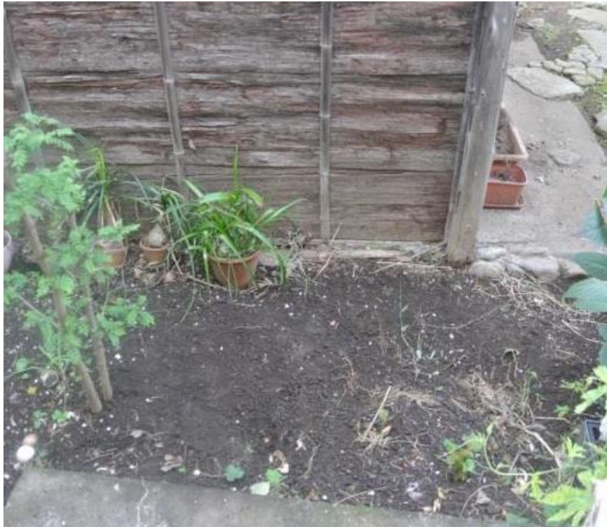
【例1：猫が排泄する場所】