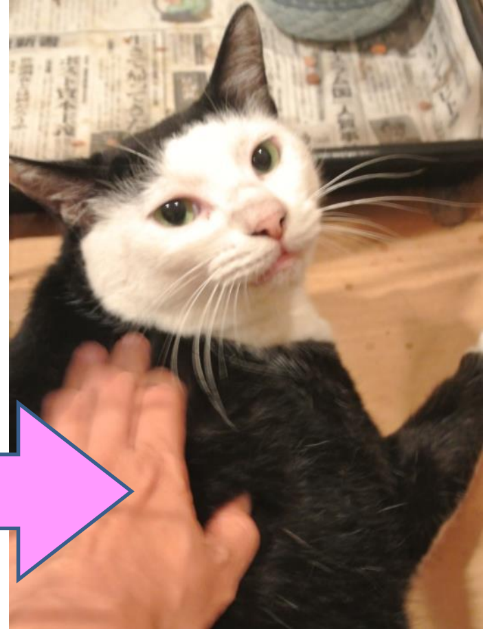
おだやかな地域猫へ